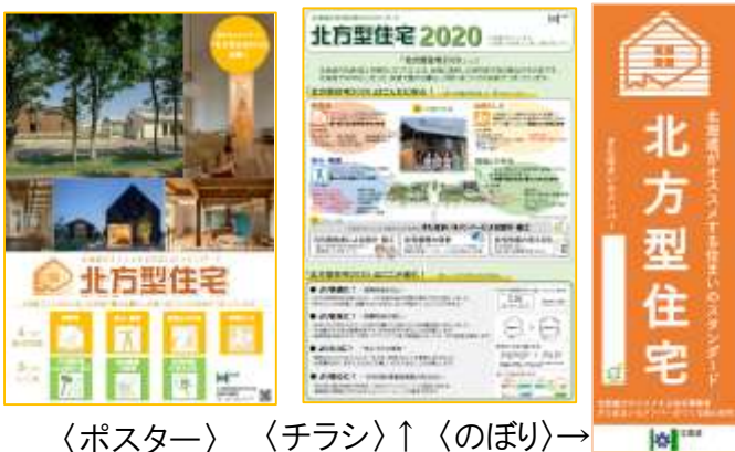
〈ポスター〉 〈チラシ〉↑ 〈のぼり〉→