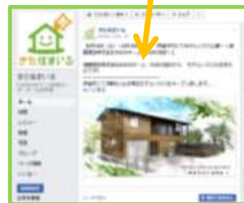
〈FBを活用した情報発信〉